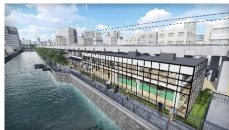
△從淺草瞭望的商業設施 (示意圖)