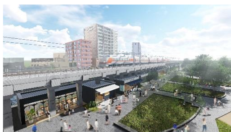
△從隅田公園瞭望的商業設施 (示意圖)

人、地區與文化的交錯，過著有如旅行般的生活，像是在生活一樣旅行。 往來在街道上，藉此與根植於地區的「下町魅力」相遇 目的型 水岸空間開發