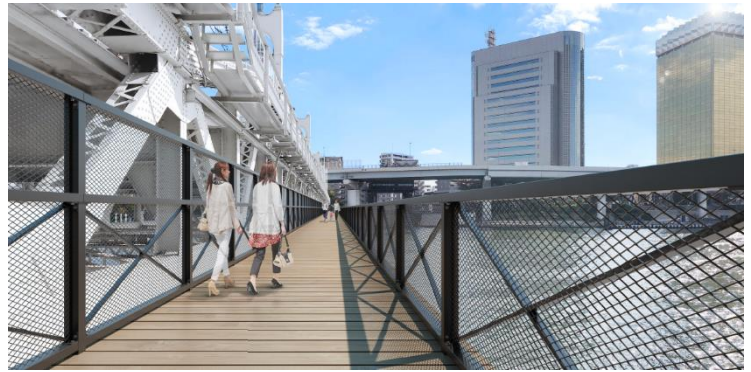
△隅田親水步道橋上（示意圖）

※推動連結淺草與東京晴空塔城的水岸整建，帶動熱鬧氣氛，高架下複合設施的詳細內容請見2019年6月25日的新聞稿「 連結淺草與東京晴空塔城 ® ，企圖提升地區的迴遊性 」，「 2020春天，連結淺草與東京晴空塔城 ® 的高架下複合設施開幕！ 」。