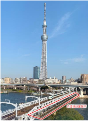
△從淺草延伸的建設位置（示意圖）